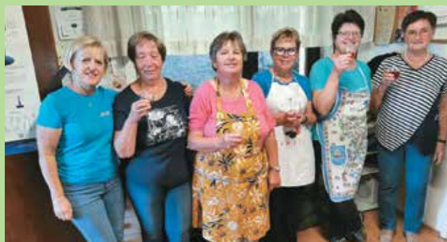
Krompirjev piknik, september 2025