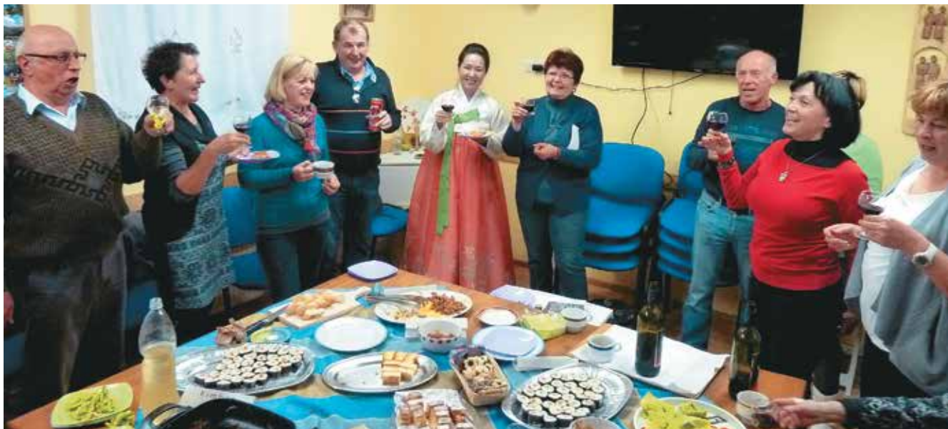
Čajanka Južna Koreja, december 2016