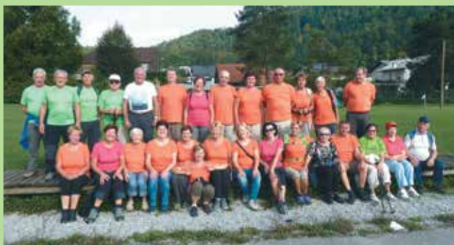
Športfejst, september 2018