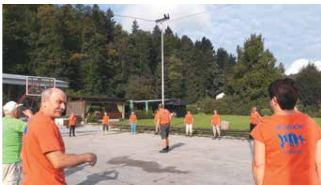
Jutranja telovadba, september 2018