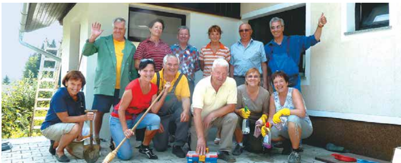
Delovna akcija ob zaključku prenove doma, avgust 2013

Neprecenljivo je spoznanje, da je v našem okolju veliko dobrih ljudi, ki so za pravo stvar, za prihodnje robove, pripravljeni žrtvovati svoj čas in denar. Vsem najlepša hvala!