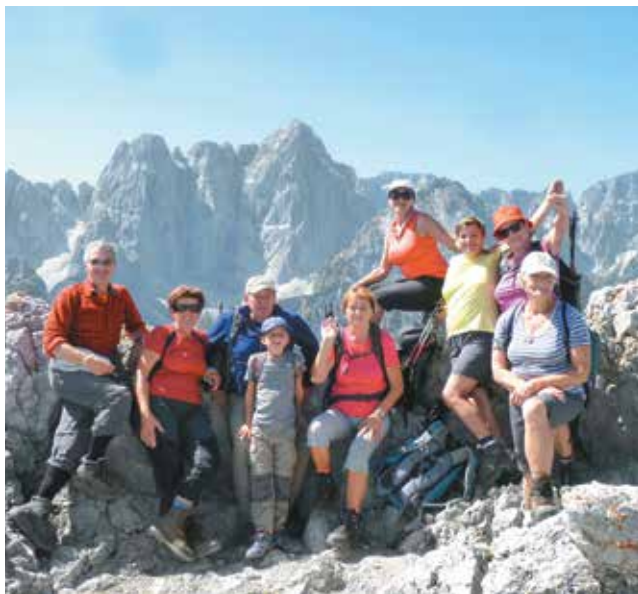
Kamniti lovec 2071 m, avgust 2017

skupina pohodnikov. Zahajamo predvsem v slovenske gore. Včasih pa si izberemo kako turo v Avstriji ali Italiji kot je Veliki Obir, Špik Hude police, Kamniti Lovec.