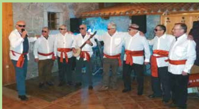
Osmica, marec 2015