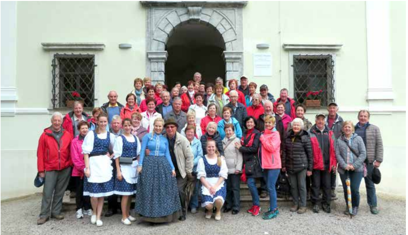
Izlet v Poljansko dolino, maj 2019