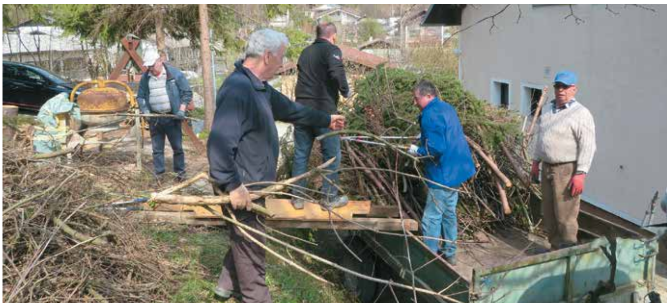
Čajanka delovna akcija, april 2019