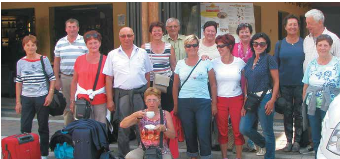
Letovanje v Italiji, Lions clubs Ferrara s poverjeniki, september 2015

Ko se človek upokoji, si želi predvsem miru in varnosti. Je čas, ko bi moralo biti skrbi manj, ne več. Kljub temu pa staranje pogosto prinese tudi slabše zdravje, pozabljivost in osamljenost.