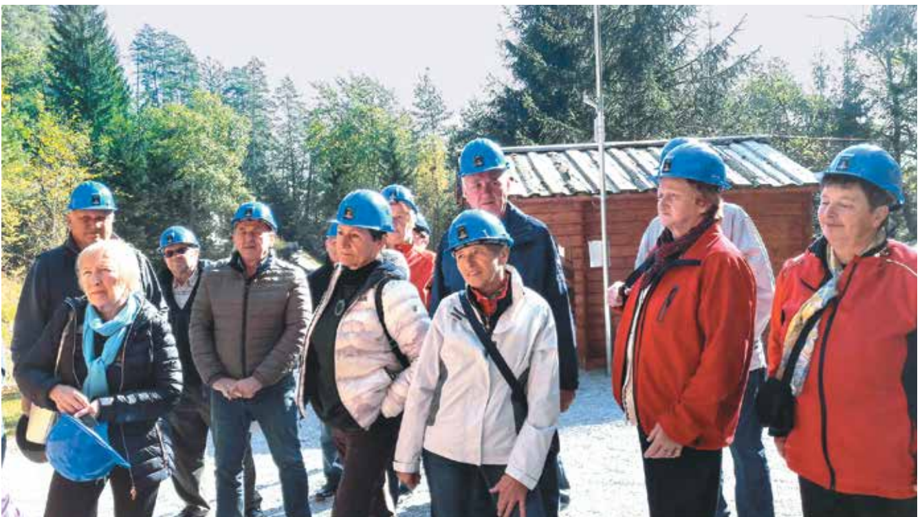
Izlet v Litijo, ogled rudnika Sitarjevec, oktober 2018