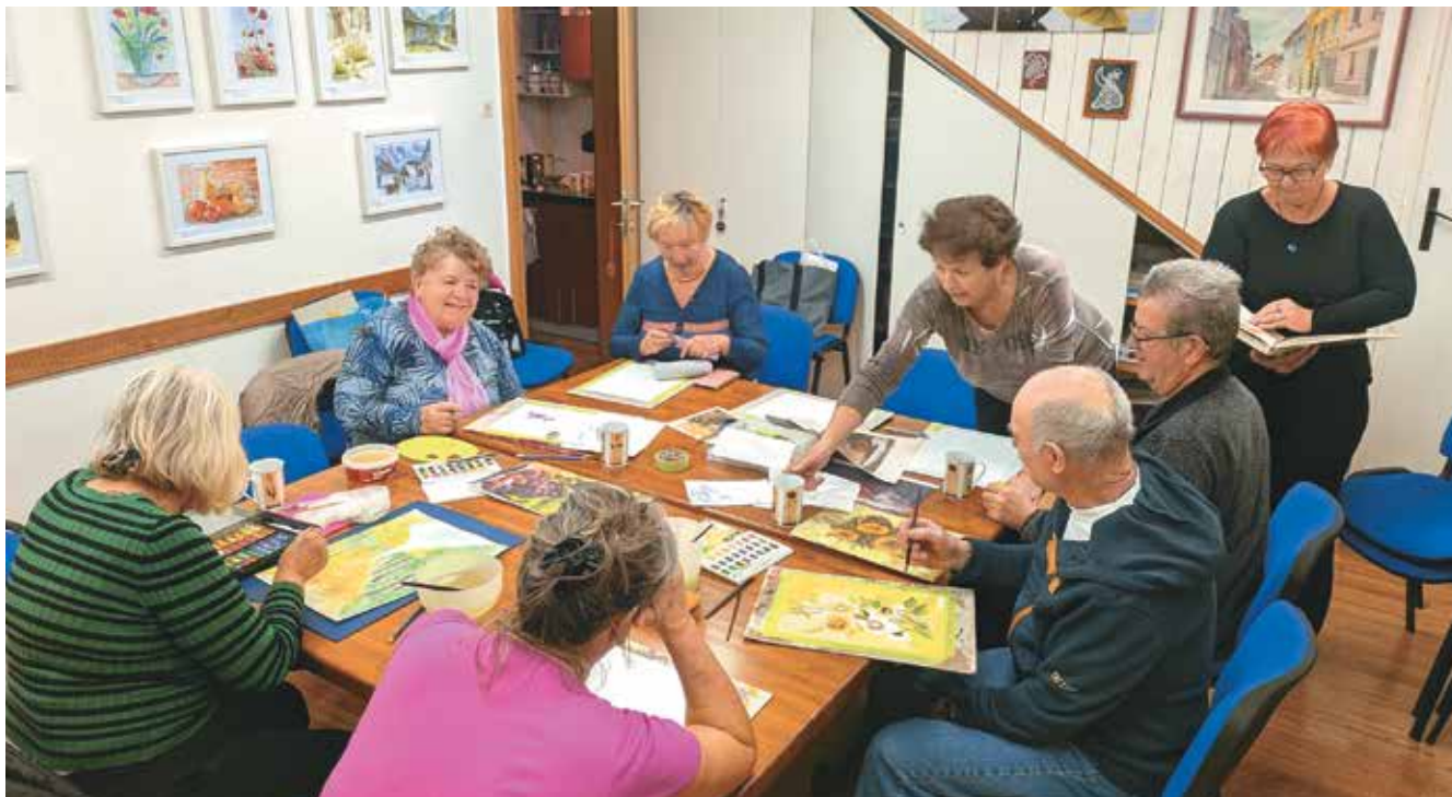
Likovna delavnica, marec 2025