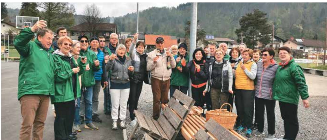
Praznovanje rojstnega dneva, april 2023