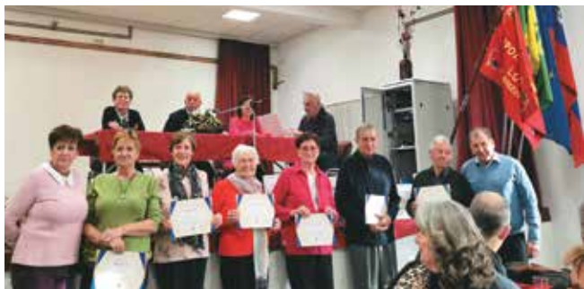
Podelitev priznanj poverjenikom za več kot 15 let delovanja, februar 2025