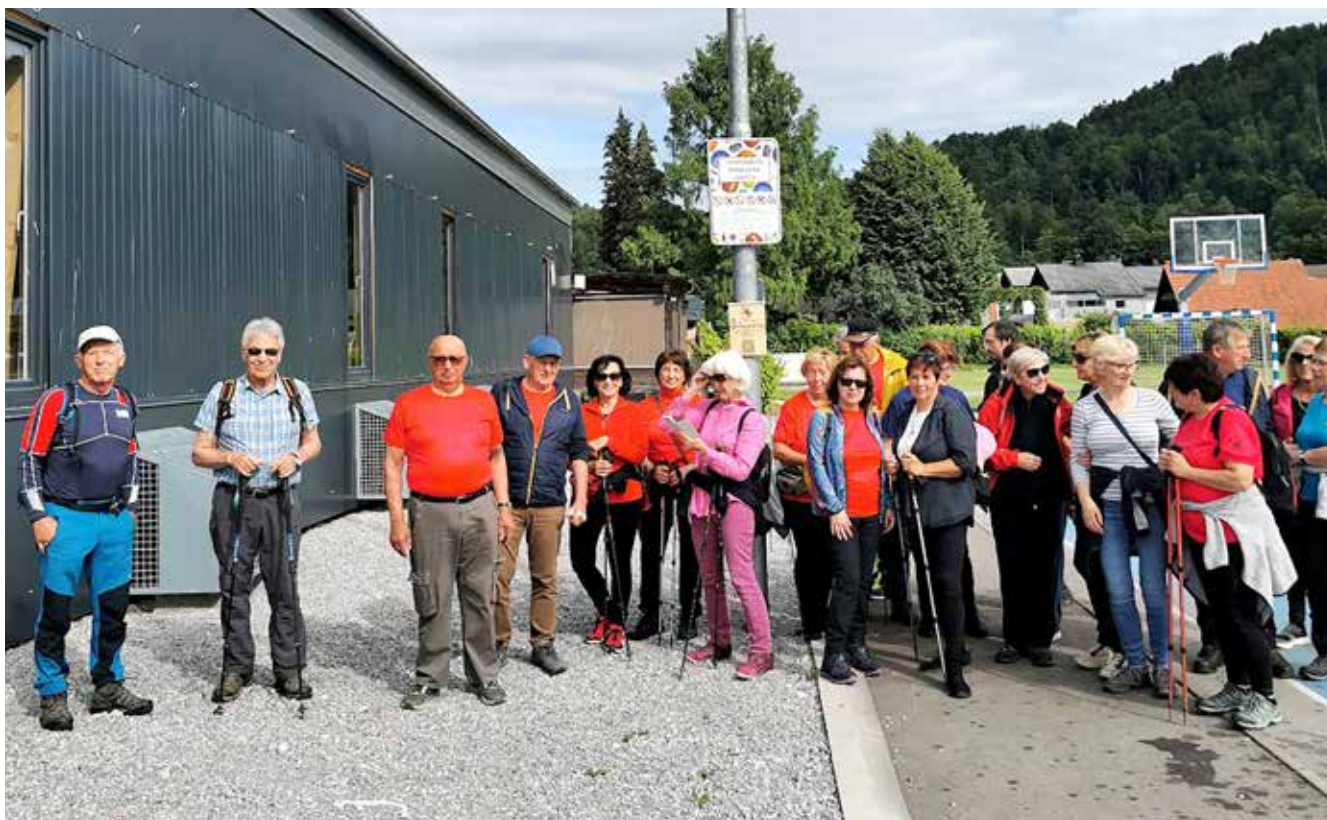
Pohod študijskega krožka Promovirajmo vodna zajetja na Logu, maj 2025