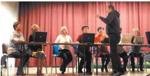
Računalniški tečaj, december 2015