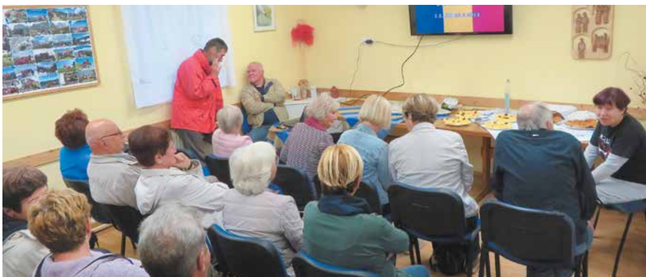
Čajanka Romunija, oktober 2019