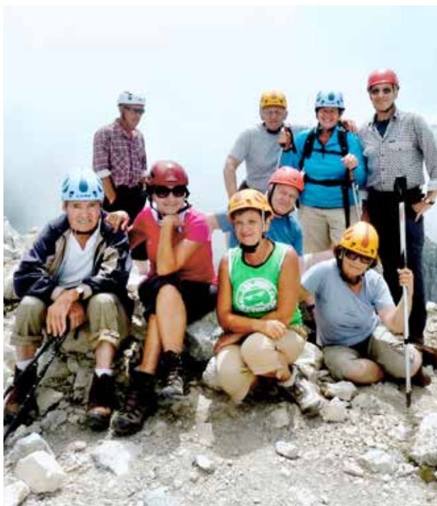
Špik hude police 2420 m, junij 2012