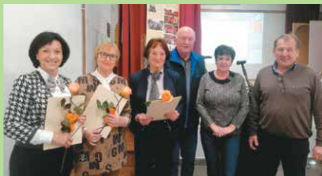
Občni zbor, februar 2023