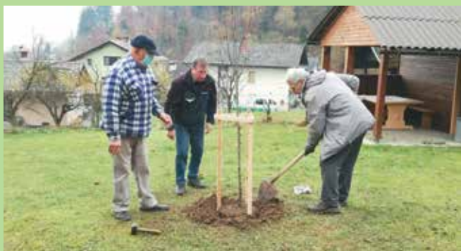
Posadili smo lipo, maj 2021