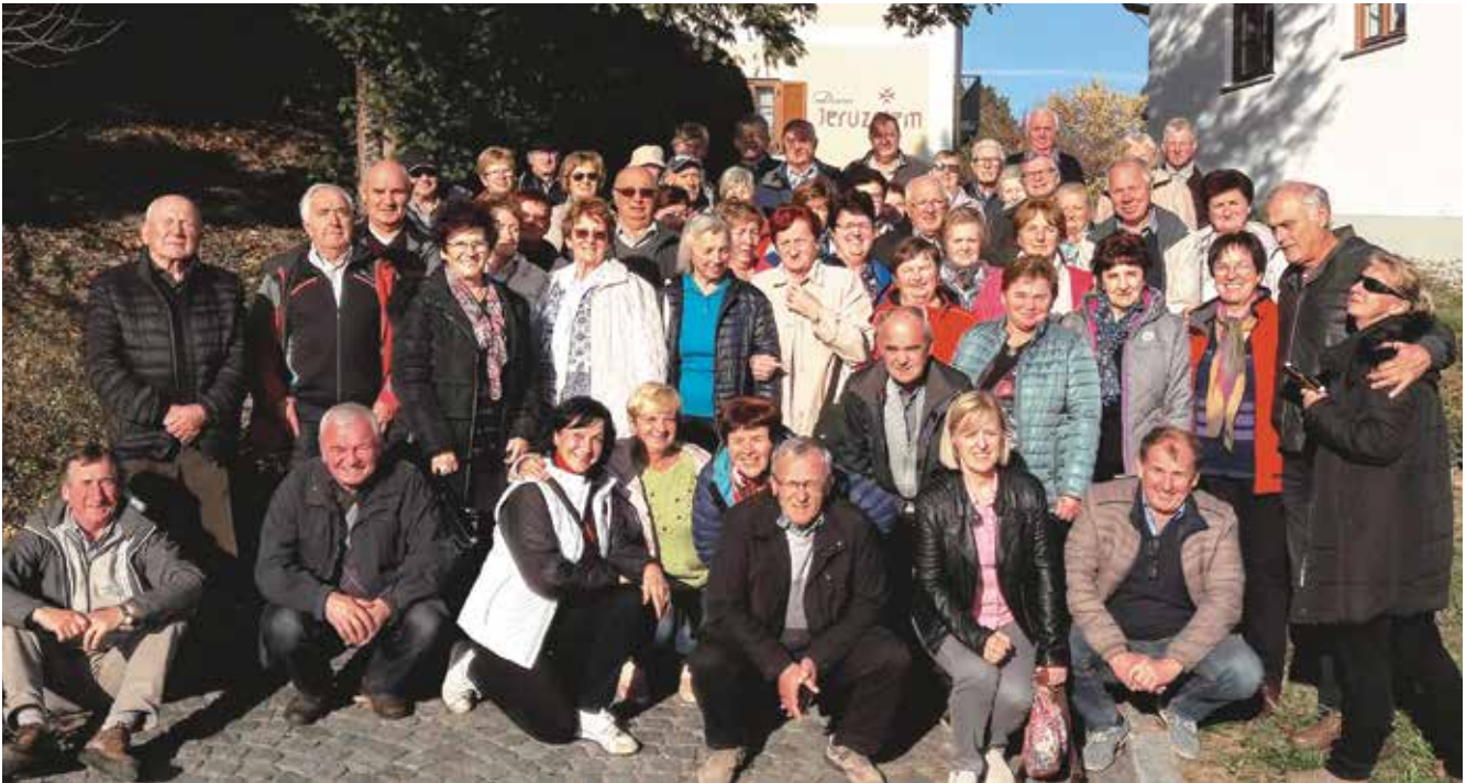
Izlet v Jeruzalem in martinovanje, november 2018