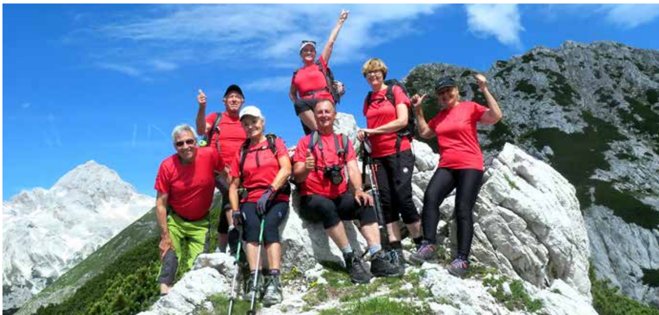
Viševnik 2050 m, junij 2024