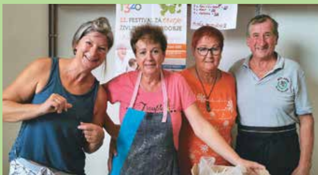
Krompirjev piknik, september 2023