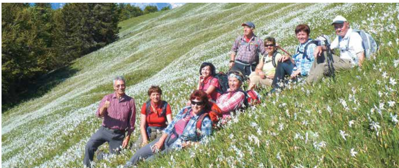
Golica 1885m, junij 2013

V vseh teh letih smo osvojili kar 120 dvatisočakov in opravili preko 850 pohodov. Najnaštejsem nekaj najvišjih vrhov, ki smo jih osvojili: Triglav, Jalovec, Kočna, Mangart, Skuta, Prisojnik, Špik itd. Nanje se je povzpela ožja