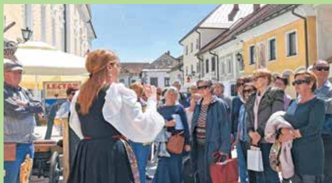
Izlet z vlakom v Radovljico, maj 2023