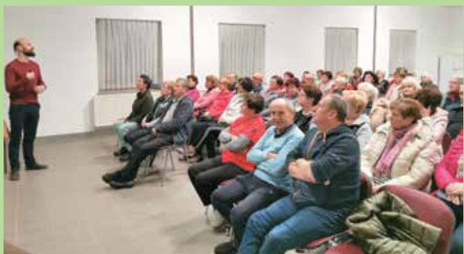
Predavanje o fasciji, november 2024