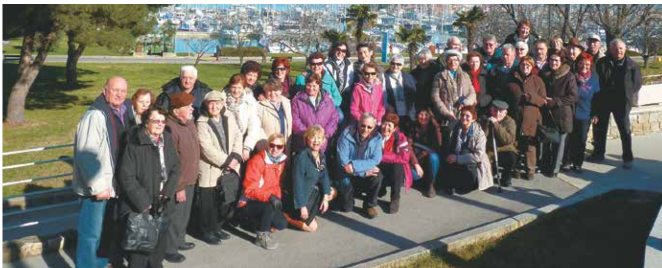
Izola hotel Delfin, februar 2015

Kot predsednik društva sem se ukvarjal s koordinacijo društev Notranjske, sodeloval z ostalimi društvi, denacionalizacijo našega doma in sproti reševal tekoče zadeve. Pri vodenju nisem nikoli imel nasprotnikov, dobro sem se razumel s člani, jim pomagal po svojih močeh in sodeloval z drugimi društvi v občini in spoznaval prijazne ljudi v naši prijazni občini. Na koncu bi se zahvalil vsem upokojujencem na Logu za sodelovanje in podporo, ki so jo nudili meni v šestletnem obdobju.