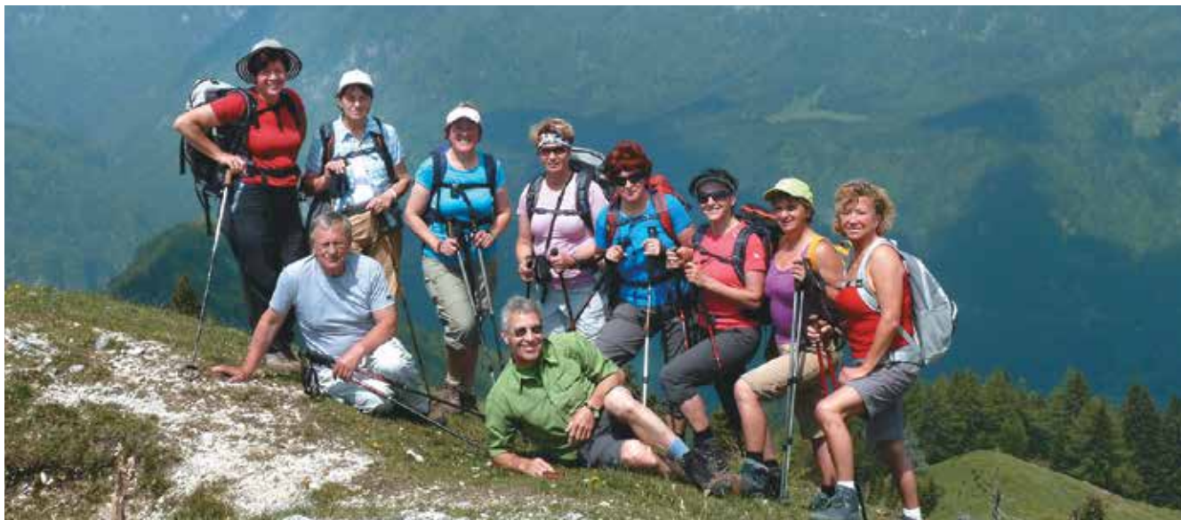
Lepenatka 1425 m, maj 2011