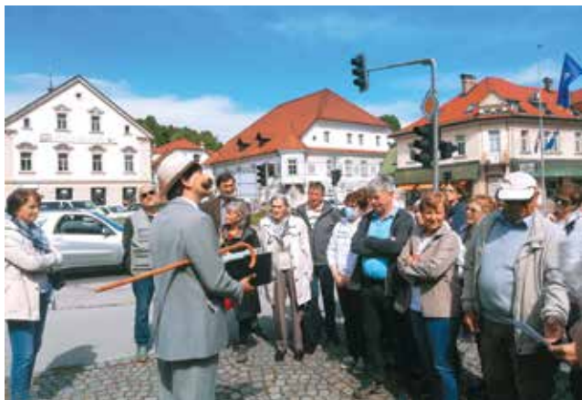
Izlet na Vrhniko, maj 2022

vinorodnih krajih, kjer v okviru izletov organiziramo vesele dogodke s plesom, dobro hrano in pijačo.