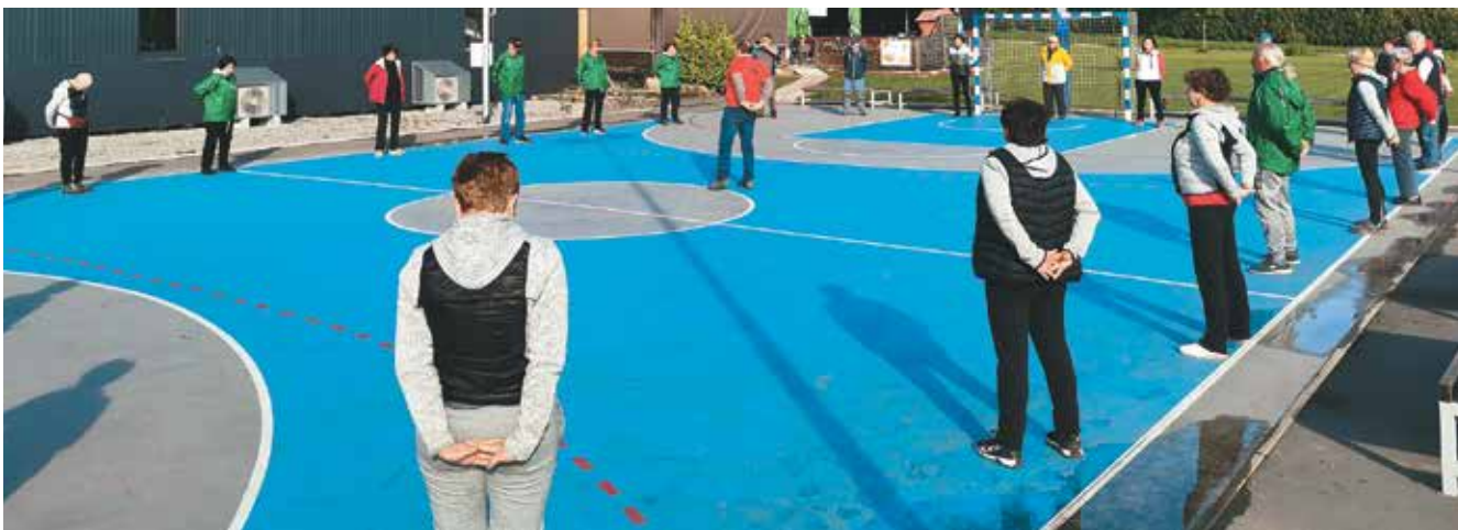
Jutranja telovadba, maj 2025